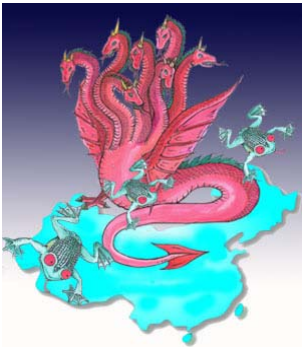
圣经启示录描述一条“大红(赤)龙，七头十角，七头上戴着七个冠冕。

答：天地万物皆有灵，共产党也不例外，只不过它是一个邪灵。中共在人间表现是一个邪恶组织，在另外空间的显象是红色恶龙（赤龙），中共崇尚红色、嗜血好杀，正体现了其邪灵本性。共产党的百年红朝就是邪灵祸乱人间，毁灭人类道德良知，欲将人带入万劫不复的地狱。