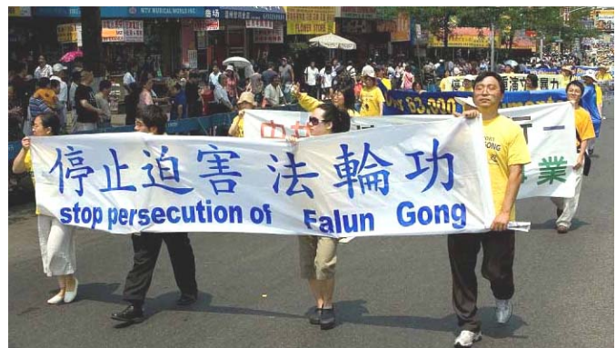
11月21日，联合国反酷刑委员会公布一项中