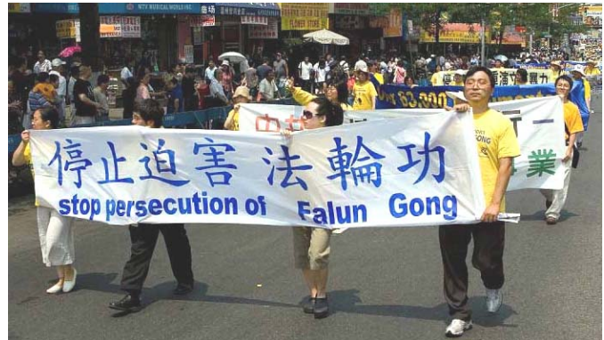
11月21日，联合国反酷刑委员会公布一项中