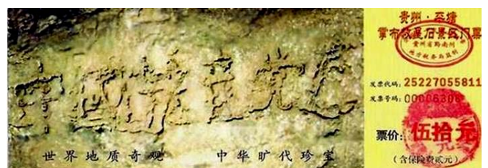
▲贵州省平塘县掌布乡风景区门票上藏字石的照片

贵州省平塘县掌布乡风景区内有一“藏字石”。经专家鉴定，500 年前有一块距今 2 亿 7 千万年的巨石从崖壁落下，落地一分为二。2002 年 6 月，石头断面被当地人发现有一行汉字，这些汉字经三批国内专家鉴定，其结论为天然形成。而石头上清晰可见的六个字是：中国共产党亡。可是 2002 年 cctv 在报道时隐去了“亡”字。