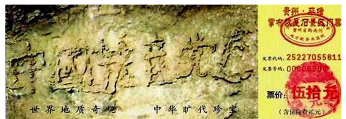
▲贵州省平塘县掌布乡风景区门票上藏字石的照片

贵州省平塘县掌布乡风景区内有一“藏字石”。经专家鉴定，500 年前有一块距今 2 亿 7 千万年的巨石从崖壁落下，落地一分为二。2002 年 6 月，石头断面被当地人发现有一行汉字，这些汉字经三批国内专家鉴定，其结论为天然形成。而石头上清晰可见的六个字是：中国共产党亡。可是 2002 年 cctv 在报道时隐去了“亡”字。