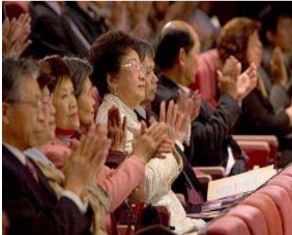
图为: 神韵晚会台北第二场, 前副总统吕秀莲全程观赏 (着白衣者)。

神韵艺术团的演出被誉为“世界顶级艺术盛会”, 以中国古典舞为主轴, 高科技的天幕设计、令人惊叹的精美服装、扣人心弦的音乐, 以及演员们的精湛表演, 绝妙的溶合为一体, 给观众带来震撼、喜悦与美好的意境。