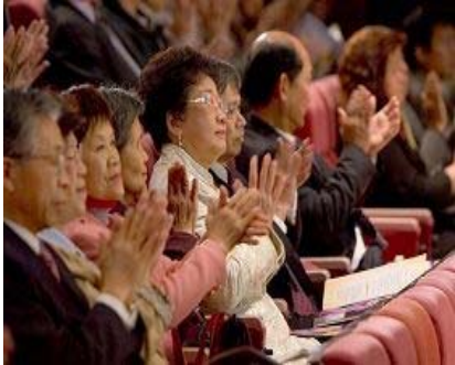
图为: 神韵晚会台北第二场, 前副总统吕秀莲全程观赏 (着白衣者)。

神韵艺术团的演出被誉为“世界顶级艺术盛会”, 以中国古典舞为主轴, 高科技的天幕设计、令人惊叹的精美服装、扣人心弦的音乐, 以及演员们的精湛表演, 绝妙的溶合为一体, 给观众带来震撼、喜悦与美好的意境。