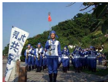
天国乐团于西子湾景点吹奏乐曲，将福音送往来的台湾游客及大陆观光团。