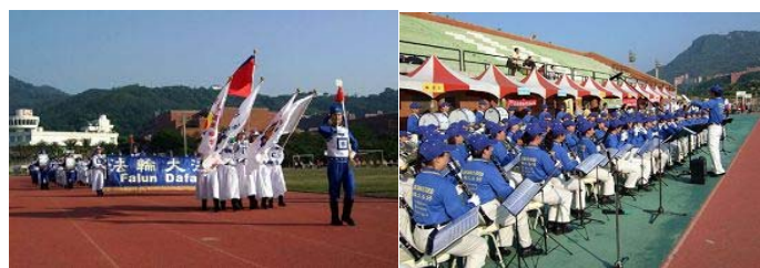
乐团引领会旗及运动员 进场

二零零八年十一月二十九日，南台湾志工运动大会于高雄中山大学隆重举行。大清早，中山大学体育场就热闹非凡，来自台湾北、中、南三区近三百名法轮大法天国乐团成员在此会师共襄盛举。天国乐团分为两队：大会乐队主掌全程活动伴奏，另一支身着官服的乐团担任校阅队伍前导，负责引领会旗及运动员进场。