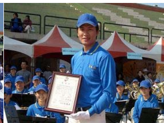
大会主办单位颁赠天国乐团感谢状