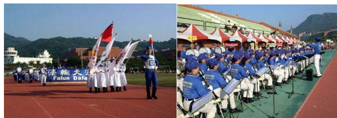
乐团引领会旗及运动员 进场

二零零八年十一月二十九日，南台湾志工运动大会于高雄中山大学隆重举行。大清早，中山大学体育场就热闹非凡，来自台湾北、中、南三区近三百名法轮大法天国乐团成员在此会师共襄盛举。天国乐团分为两队：大会乐队主掌全程活动伴奏，另一支身着官服的乐团担任校阅队伍前导，负责引领会旗及运动员进场。