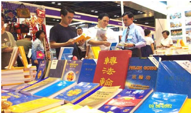
新加坡世界书展中的各语种法轮功书籍。

1995 年 3 月和 5 月，李洪志老师应邀到法国和瑞典传功讲法，拉开了法轮大法在海外洪传的序幕。至今，法轮功已洪传世界 80 多个国家和地区。仅台湾一地，修炼人数就由最初的数千人，增加至