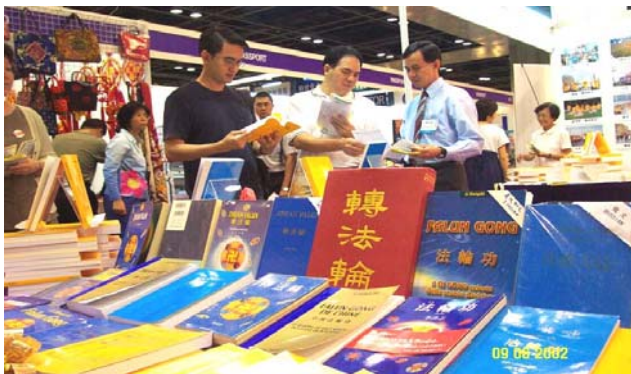
新加坡世界书展中的各语种法轮功书籍。

1995 年 3 月和 5 月，李洪志老师应邀到法国和瑞典传功讲法，拉开了法轮大法在海外洪传的序幕。至今，法轮功已洪传世界 80 多个国家和地区。仅台湾一地，修炼人数就由最初的数千人，增加至