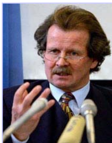
联合国酷刑问题专员诺瓦克多次向联合国酷刑委员会提出法轮功学员被活摘器官的指证

十一月七日，联合国反酷刑委员会的专家对中国执行《禁止酷刑公约》的情况进行质询。在发现作为缔约国的中国未能履行公约中的条款后，反酷刑委员会十一月二十一日命令中共对法轮功学员器官被活摘的指控和对这场对法轮功