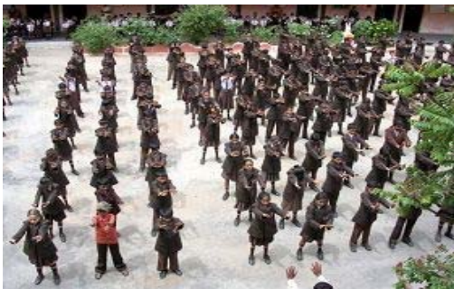
学校学生集体炼功

【明慧网】二零零八年八月十五日，带着曾经对热心推广法轮功的印度学校校长及学员的承诺及期待，我三度搭机前往印度邦加罗尔 (Bangalore)。