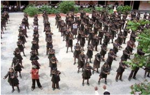
学校学生集体炼功

【明慧网】二零零八年八月十五日，带着曾经对热心推广法轮功的印度学校校长及学员的承诺及期待，我三度搭机前往印度邦加罗尔 (Bangalore)。