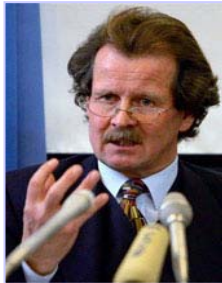
联合国酷刑问题专员诺瓦克多次向联合国酷刑委员会提出法轮功学员被活摘器官的指证

十一月七日，联合国反酷刑委员会的专家对中国执行《禁止酷刑公约》的情况进行质询。在发现作为缔约国的中国未能履行公约中的条款后，反酷刑委员会十一月二十一日命令中共对法轮功学员器官被活摘的指控和对这场对法轮功