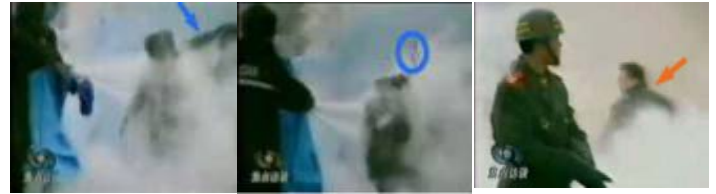
1.刘头部受重击 2.击打后飞出的重物 3.打击者仍保持用力姿势

如果把中央电视台——CCTV《焦点访谈》提供的录像镜头放慢可以看见，被官方媒体称为自焚而死的刘春玲身上的火焰已经基本熄灭，突然，有人用物体猛击她的头部，刘春玲随即倒地，一条状物快速弹起，从死者脑后飞出，又以极快的速度从空中落下。