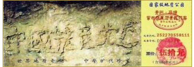
上图是贵州省平塘县掌布乡风景区门票

冥冥之中有天意。史料上也有关于“藏字石”的记载：秦始皇 36 年，天降坠石，有字现石上曰：“始皇帝死而地分。”果然，秦始皇死后不久秦朝就灭亡了，准确预言了天意。千百年来的中国，在