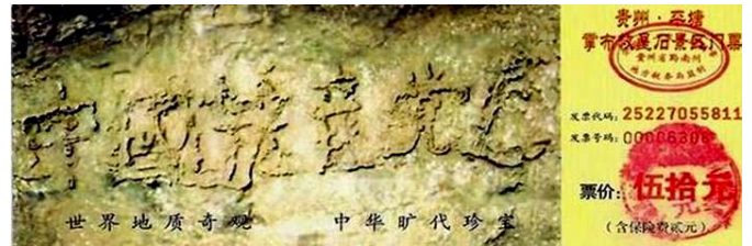
贵州省平塘县掌布乡风景区门票上藏字石的照片

因为中共恶贯满盈，连上天都不能容忍。就使得奇异的天象频频出现。从贵州省“中国共产党亡”的藏字石（下图）出现，到现在的双星伴月的出现。都预示着中国共产党的灭亡。