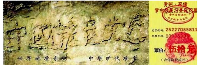
贵州省平塘县掌布乡风景区门票上藏字石的照片

因为中共恶贯满盈，连上天都不能容忍。就使得奇异的天象频频出现。从贵州省“中国共产党亡”的藏字石（下图）出现，到现在的双星伴月的出现。都预示着中国共产党的灭亡。