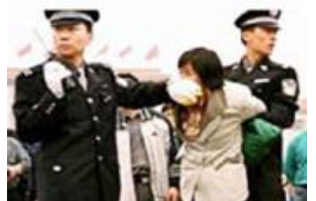
人们说真话的权利也被剥夺

法轮功的活动都是公开的，书籍可以在互联网上免费下载阅读。然而中共为了制造一言堂的舆论，迫害一开始就大量销毁法轮功的书籍，封锁互联网的信息，让人们无法了解事实。