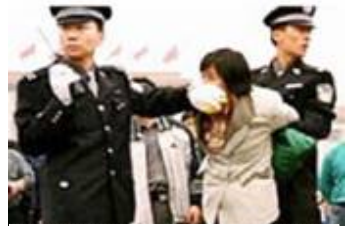
人们说真话的权利也被剥夺

法轮功的活动都是公开的，书籍可以在互联网上免费下载阅读。然而中共为了制造一言堂的舆论，迫害一开始就大量销毁法轮功的书籍，封锁互联网的信息，让人们无法了解事实。