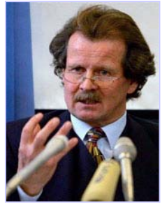
联合国酷刑问题专员诺瓦克多次向联合国酷刑委员会提出法轮功学员被活摘器官的指证

十一月七日，联合国反酷刑委员会的专家对中国执行《禁止酷刑公约》的情况进行质询。在发现作为缔约国的中国未能履行公约中的条款后，反酷刑委员会十一月二十一日命令中共对法轮功学员器官被活摘的指控和这场对法轮功迫害的责任人进行调查。