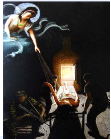
水粉画《悼念被活摘器官的大法弟子》表现被活体摘取器官的法轮功女学员将要被投入炼人炉的恐怖场面。菩萨伸出了手象征着修炼人的永生。手握枪冷酷执行命令的看守士兵已经被邪恶党性代替了人性，等待他的只有正义的审判。