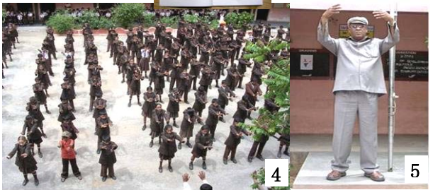
图 4/JYOTHI 学校全校师生在体育课上练习法轮功。