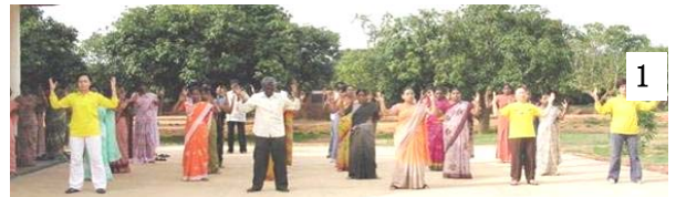
图 1、 2/Byreshawara 学校全校师生在体育课上练习法轮功。