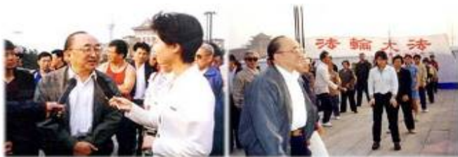
1998年国家体育总局局长伍绍祖亲赴长春视察群众修炼法轮功的情况。

1998年下半年，以乔石为首的部分全国人大离退休老干部，对法轮功进行了详细调查、研究，得出“法轮功于国于民有百利而无一害”的结论，并于年底向江泽民为首的政治局提交了调查报告。这也是在职及离休的中共二百名以上高级干部几次致中共中央联名信反复申说的话。