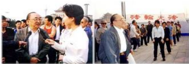
1998年国家体育总局局长伍绍祖亲赴长春视察群众修炼法轮功的情况。

1998年下半年，以乔石为首的部分全国人大离退休老干部，对法轮功进行了详细调查、研究，得出“法轮功于国于民有百利而无一害”的结论，并于年底向江泽民为首的政治局提交了调查报告。这也是在职及离休的中共二百名以上高级干部几次致中共中央联名信反复申说的话。