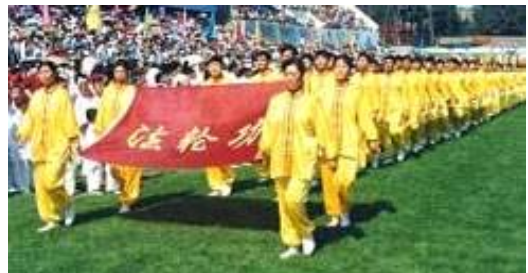
法轮功学员在亚洲体育节（沈阳1998）开幕式上。

1993年12月在北京东方健康博览会上，李洪志先生获博览会最高奖“边缘科学进步奖”，和大会的特别金奖，以及“受群众欢迎气功师”称号，在该届博览会上李洪志先生是荣获奖励最多的气功师。