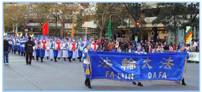
十二月六日，近百名法轮功学员组成的天国

希望之声等多家媒体的联合采访，对神韵演出赞不绝口。“简直就是美轮美奂、无与伦比的演出！视觉上超凡脱俗！除了艺术的美，重要的是应该看到这表演背后的伦理内涵，所带来的讯息实在很正，展现了人性的光辉，在道德精神上催人向上，让人性获得升华，实在令人钦佩。我感觉非常非常荣幸能看到这样的演出。希望这个演出能在美国的每个城市上演。我对其中一首歌曲印象很深刻，其中谈到无神论对人类当前所造成的伤害，真的令人动容。不管人生面临什么困境，真理才是普世、永恒的价值。人类不会被（无神论）毁灭。这场演出教导关于人性的终极思考，以及邪不胜正的讯息。”◇