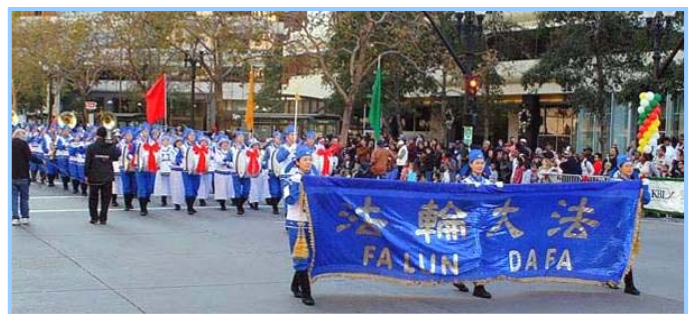
十二月六日，近百名法轮功学员组成的天国