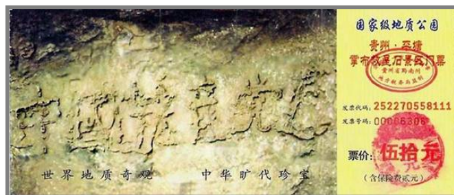
图为贵州省平塘县掌布乡风景区门票

2002 年 6 月，在贵州省平塘县掌布乡风景区发现了距今 2.7 亿岁的“藏字石”，巨石断面惊现六个大字： 中国共产党亡 。经专家考证未发现人工雕琢痕迹，CCTV 曾经有过专题报道，央视十套 2004 年 8 月 2 日 20:30 播出的《走进科学》就是专题片《揭秘“藏字石”》。国内一百多家媒体都有过报道与专题，但都隐去“亡”字。天灭中共，这不仅是苍生之愿，也是即将到来的现实！