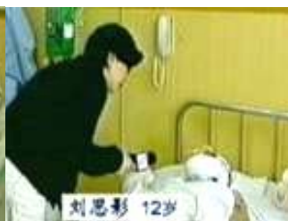
气管切开还能说唱？记者采访不穿防护服不戴口罩。