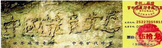
贵州省平塘县掌布乡风景区门票上藏字石的照片

很多人看清了“藏字石”传达的天意——“天灭中共”，而只有三退（退出党团队），声明废除把生命献给中共的毒誓才能在大难中免于淘汰。如今三退大潮势不可挡，三退人数已超过4753万。◇