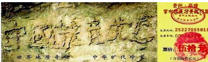
贵州省平塘县掌布乡风景区门票上藏字石的照片

很多人看清了“藏字石”传达的天意——“天灭中共”，而只有三退（退出党团队），声明废除把生命献给中共的毒誓才能在大难中免于淘汰。如今三退大潮势不可挡，三退人数已超过4753万。◇