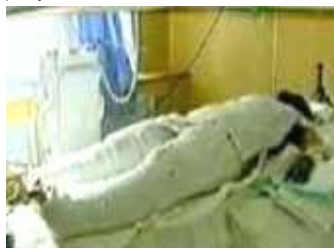
央视《焦点访谈》中的“自焚者”被包裹得严密。