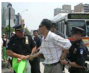
美国警察逮捕谩骂法轮功学员的中共暴徒。

美国【明慧网】 零八年五至六月，在中共政法委书记周永康的策划下，中共从国内到海外配合式构陷法轮功，继续制造谎言煽动中国民众和海外华人对法轮功的仇恨。在中领馆的幕后组织下，五月十七日，暴徒大规模骚扰和围攻纽约退党服务中心，并殴打退党服务中心员工。并在此后数日，在法拉盛的“九评”资料点连续发生严重恶性围攻和威胁工作人员的事件。之后中共新华网和央视国际将此事件谎编成“纽约华人为四川震灾募捐，法轮功现场捣乱”，公开对十三亿中国人撒谎和行骗，妄想煽动民众的仇恨。