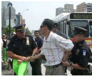
美国警察逮捕谩骂法轮功学员的中共暴徒。

美国【明慧网】 零八年五至六月，在中共政法委书记周永康的策划下，中共从国内到海外配合式构陷法轮功，继续制造谎言煽动中国民众和海外华人对法轮功的仇恨。在中领馆的幕后组织下，五月十七日，暴徒大规模骚扰和围攻纽约退党服务中心，并殴打退党服务中心员工。并在此后数日，在法拉盛的“九评”资料点连续发生严重恶性围攻和威胁工作人员的事件。之后中共新华网和央视国际将此事件谎编成“纽约华人为四川震灾募捐，法轮功现场捣乱”，公开对十三亿中国人撒谎和行骗，妄想煽动民众的仇恨。