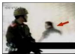
4、击打者仍保持用力姿势

华盛顿邮报记者菲力蒲·潘在事发之后，立即前往在事件中死亡的刘春玲原居住地开封进行采访。2001年2月4日，华盛顿邮报在头版发表题为“自焚的火焰照亮了中国的黑幕——当众自