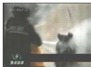
2、击打后飞出的重物