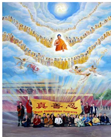
作者：周怡秀、陈肖平 油彩：51cm×64cm

本画所描绘的是，2001年11月20日，来自十三个国家的三十六名西人大法弟子，跨越千山万水，在天安门前打出了一面八英尺长，写着中英文“真、善、忍”的大横幅，带给世界巨大的震撼。画面上，金光万丈，天上人间，所有的眼光都注视着这震撼历史的一刻。