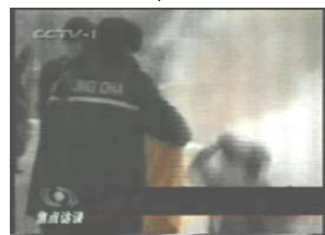
3、手摸被打后的头部