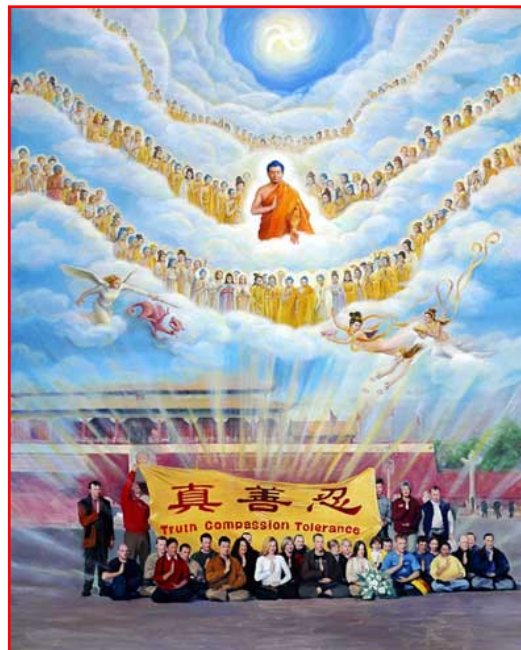
真善忍美展作品:《为你而来》