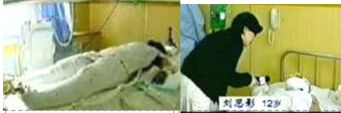
央视《焦点访谈》中的“自焚者”被包裹得严密。 气管切开还能说唱？记者采访不穿防护服不戴口罩。