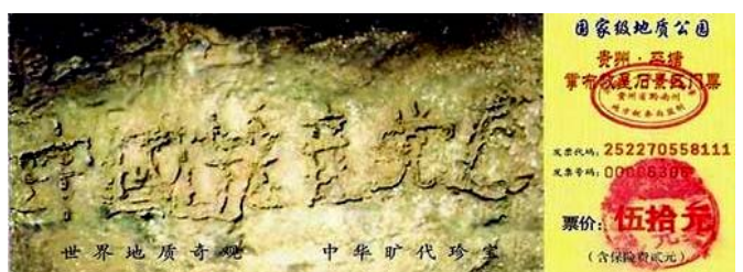
图为藏字石风景区门票：“中国共产党亡”清晰可见

1991年以前，苏联强大不强大？全球两大超级大国，它是其中之一。1988年看过一本小册子，说到苏联几年之后会解体，当时谁相信？89年、90年、直到91年8月，都没有几个人相信。可是，就在1991年8月19日，砰然一声，一个庞大的苏联共产党解体了！一个强大的苏共政权倒台了！朝代兴亡由天定，不以人的意志为转移。