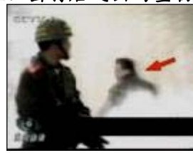
4、击打者仍保持用力姿