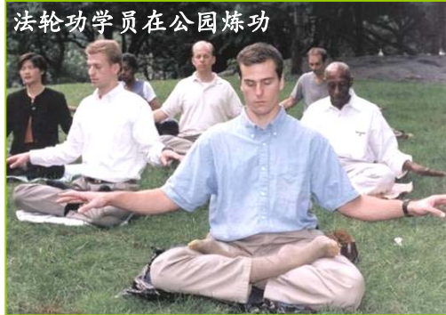
法轮功学员在公园炼功

我们认为苦难是人生经历的本色，是人在世上或前世做了不好的事情而产生的业力带来的。我们没有规定不能吃药，也不