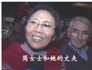
简女士和她的丈夫

简女士的丈夫是一名音乐工作者，他完全被“神韵”折服，他评价神韵的音乐：“音乐非常美，让我有了一个伟大的经历。◇