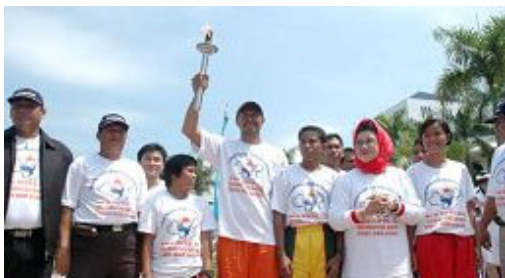
丽耀群岛首长夫人将人权圣火火焰交给田径队伍代表

【明慧网】法轮功受迫害真相联合调查团发起的人权圣火在印尼的巡回传递活动于二零零八年一月四日起在首都雅