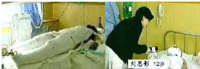
央视《焦点访谈》中的“自焚者”被包裹得严密。

◆ CCTV《焦点访谈》说警察“不到一分钟”，就“迅速扑灭了火焰”，那么一分钟内数十个灭火器和灭火毯是从哪弄来的？