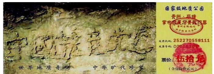
贵州省平塘县掌布乡风景区门票

明慧网二零零六年九月十三日消息，二〇〇三年六月，在贵州省平塘县境内掌布乡发现一巨石，石壁上凸显一排字迹，可清晰的辨识有六个大字：中国共产党亡。字体大小相当，分布均匀。这便是震惊世界的地质奇观——“藏字石”。经专家鉴定，此百吨巨石有两亿七千万年的绵长历史，五百年前从山崖坠落，座地一分为二，巨石断面上没有任何人工雕凿及人为加工的痕迹，“中国共产党亡”六