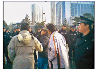
当局出动两万多名警察，围堵驱赶上访的蚂蚁养殖户。

政府的答复激起了养殖户的愤怒和不满。众所周知，八年多来，中共是怎样迫害法轮功学员的：用谎言加暴力，一边封锁真相，一边用中共媒体大肆造谣，煽动仇恨，为迫害铺路。随后而来的各种酷刑手段，至少使三千多位法轮功学员失去生命。难道中共政府也要这样对待这些被骗的养殖户吗？