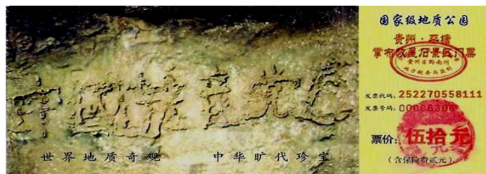
贵州省平塘县掌布乡风景区门票