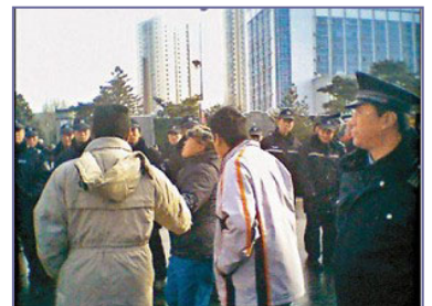
当局出动两万多名警察，围堵驱赶上访的蚂蚁养殖户。

政府的答复激起了养殖户的愤怒和不满。众所周知，八年多来，中共是怎样迫害法轮功学员的：用谎言加暴力，一边封锁真相，一边用中共媒体大肆造谣，煽动仇恨，为迫害铺路。随后而来的各种酷刑手段，至少使三千多位法轮功学员失去生命。难道中共政府也要这样对待这些被骗的养殖户吗？