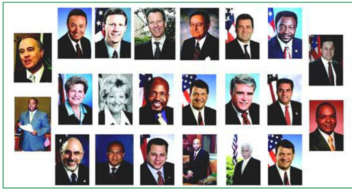
纽约七十多位政要（部份）预祝神韵演出圆满成功