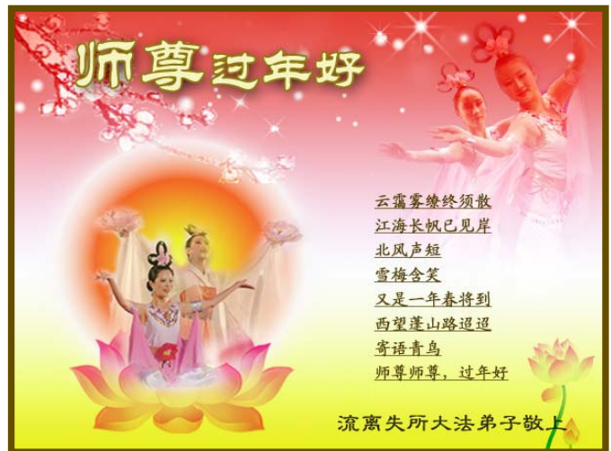
▲中国大陆受迫害流离失所的大法弟子向师尊拜年