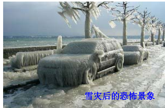
雪灾后的恐怖景象

当我们看着困在路上、车站的司机、旅客，还有房屋倒塌、停电断水的灾民，有没有想过，风调雨顺、国泰民安究竟从何而来？从遵循天理良心中来，从与