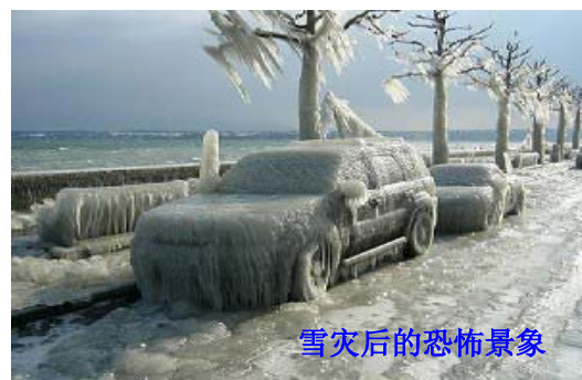
雪灾后的恐怖景象

当我们看着困在路上、车站的司机、旅客，还有房屋倒塌、停电断水的灾民，有没有想过，风调雨顺、国泰民安究竟从何而来？从遵循天理良心中来，从与