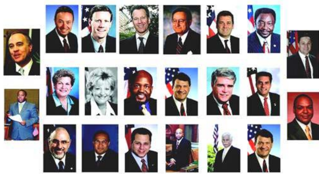
上图为纽约七十多位政要为“神韵”发来贺信和褒奖

的中华神传文化之美，被东西方观众誉为“世界顶级演出”、“净化心灵的盛宴”。神韵纽约艺术团和神韵巡回艺术团会师于纽约，在曼哈顿无线电城音乐厅为观众呈现盛大演出。