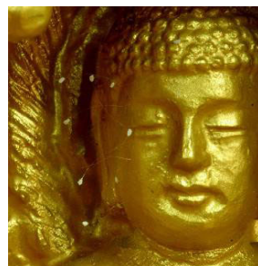
韩国须弥山禅院的佛像脸上长出的优昙婆

佛经记载：三千年开花一次的优昙婆罗花的出现意味着转轮圣王已下世在人间正法。今年按佛记是3034年。优昙婆罗花的出现也引起网民的热烈讨论，民间有专门的网站收集各地花开的资讯。官方电视台，如重庆、山西、甚至中央2台，都有专门的新闻报导，一时间小小奇花，传遍中华。与“藏