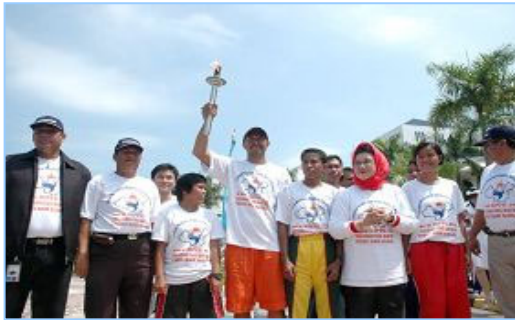
▲ 丽耀群岛长官夫人（右三）将人权圣火火焰交给田径队伍代表

数十家媒体对此活动表示关注，印尼的主流媒体特地从雅加达赶来采访与报道。到来的民众纷纷到支持“人权圣火”和呼吁制止中共迫害法轮功的百万征签的桌台上签名以表支持。