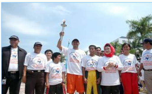
▲ 丽耀群岛长官夫人（右三）将人权圣火火焰交给田径队伍代表

数十家媒体对此活动表示关注，印尼的主流媒体特地从雅加达赶来采访与报道。到来的民众纷纷到支持“人权圣火”和呼吁制止中共迫害法轮功的百万征签的桌台上签名以表支持。