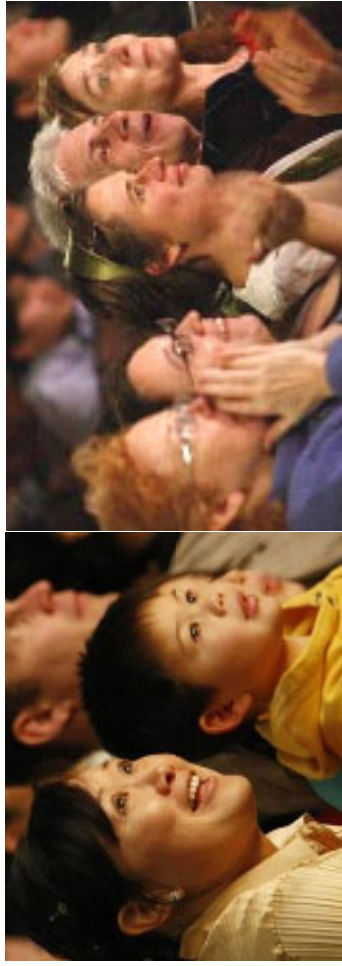
▲神韵晚会现场观众们的陶醉表情

《觉醒》表现面对迫害，人们最终觉醒而站出来抵制恶势力、支持正义的那一幕，我都忍不住要落泪。我从中看到正义凝聚的无穷力量。我觉得这台晚会将使越来越多的人受到感召，明白人该追求些什么，选择什么样的生活，从而善化整个世界。