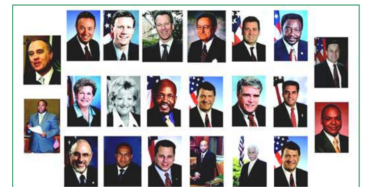
纽约七十多位政要（部份）预祝神韵演出圆满成功