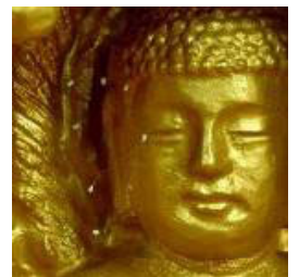
佛像上出现佛家 传说中的优昙婆罗花

据佛经《法华文句·四上》：“优昙花者，此言灵瑞，三千年一现。”《慧琳音义》卷八也载明：“优昙婆罗花为祥瑞灵异之所感，乃天花，为世间所无，若如来下生、金轮王出现世间，以大福德力故，