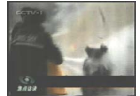
2、击打后飞出的重物