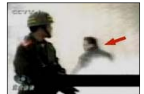
4、击打者仍保持用力姿势