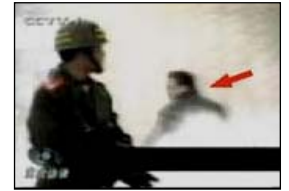
4、击打者仍保持用力姿势