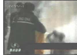
3、手摸被打后的头部