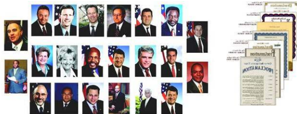
左：纽约七十多位政要为神韵发来贺信与褒奖。 右：美国德州十八位市长给神韵的嘉奖令。

西方人在观看后被中华神传文化博大精深的内涵所折服；海外华人看后更是激动不已，深感神韵复兴了中华文化，是所有华人的骄傲。