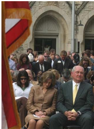
美国州长普度夫妇在祈雨仪式上虔诚祷告

也许您会吃惊，但这却是我们中华传统文化几千年来固有的认识。中国古代每逢遭遇天灾，人们除了祈求上天的庇护外，最重要的是反省自己哪里做的不好。皇帝也要下「罪己诏」。据殷商史书上记载，商朝的开国君主成汤在位时，因久旱无雨，作为一国之君的成汤就沐浴斋戒，在桑林旷野中向神祷告，并深刻反省自己的