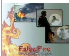
揭露自焚的影片《伪火》获第51届哥伦布国际电影节荣誉奖。