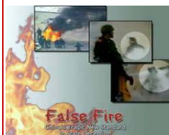
揭露自焚的影片《伪火》获第51届哥伦布国际电影节荣誉奖。