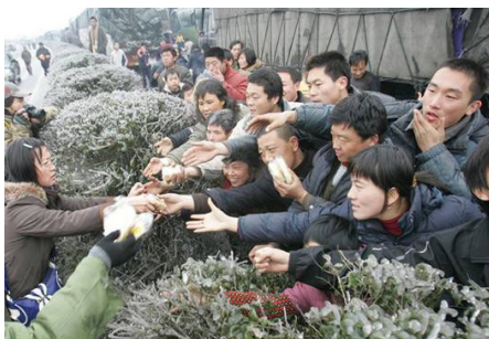
2.7 万辆车、8 万多名乘客和司机滞留在京珠高速公路湖南境内，有些乘客被困几天没吃东西。图为被困人群抢食品