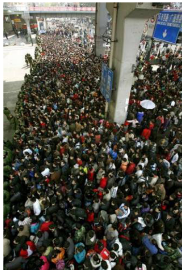
每天都有近 10 万人滞留的广州火车站