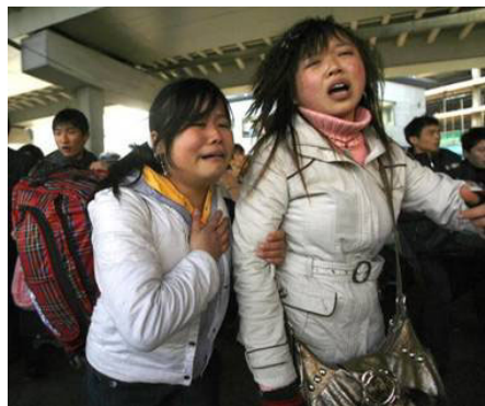
广州火车站，两年轻女性面对混乱的场面无助的哭泣。