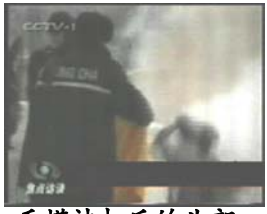
3、手摸被打后的头部 4、击打者仍保持用力姿势