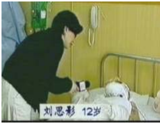
气管切开还能说、唱？记者采访不穿防护服，不戴口罩