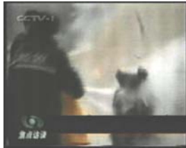
2、击打后飞出的重物