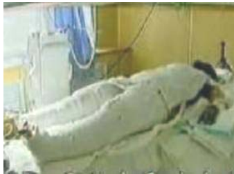
央视《焦点访谈》中的“自焚者”被包裹得严密。