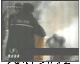
3、手摸被打后的头部 4、击打者仍保持用力姿势