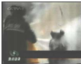
2、击打后飞出的重物