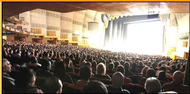
纽约神韵压轴场爆满 各界人士赞叹

四节气中最早制订出的一个。时间在每年的阳历12月22日或者23日之间。北方地区有冬至宰羊，吃饺子、吃馄饨的习俗，南方地区在这一天则有吃冬至米团、冬至长线面和狗肉的习惯。各个地区在冬至这一天还有祭天祭祖的习俗。