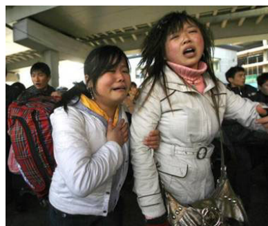
广州火车站，两年轻女性面对混乱的场面无助的哭泣。

雪灾、萨斯、沙尘暴只是上天一点小小的警告，赶紧醒悟吧！脱离这个即将被上天所清算的邪党，退出其党团组织，那么，上天对中共的任何惩罚、任何天灾人祸你就都可以平安度过了。