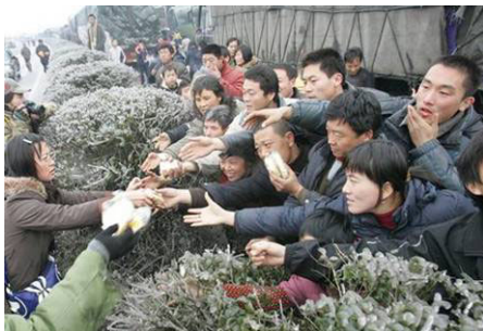
2.7万辆车、8万多名乘客和司机滞留在京珠高速公路湖南境内，有些乘客被困几天没吃东西。图为被困人群抢食品

这种临灾自省的文化在中国延续了几千年，可是今天的中国人在中共“无神论”的洗脑教唆下，已经失去了这种自我反省的思想和能力了。