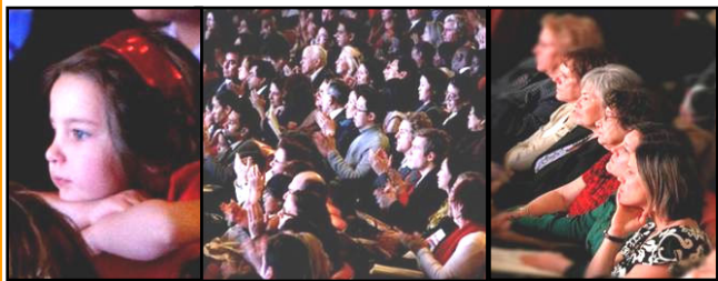
世界一流的演出博得了各族裔民众满场掌声和喝彩

四节气中最早制订出的一个。时间在每年的阳历12月22日或者23日之间。北方地区有冬至宰羊，吃饺子、吃馄饨的习俗，南方地区在这一天则有吃冬至米团、冬至长线面和狗肉的习惯。各个地区在冬至这一天还有祭天祭祖的习俗。