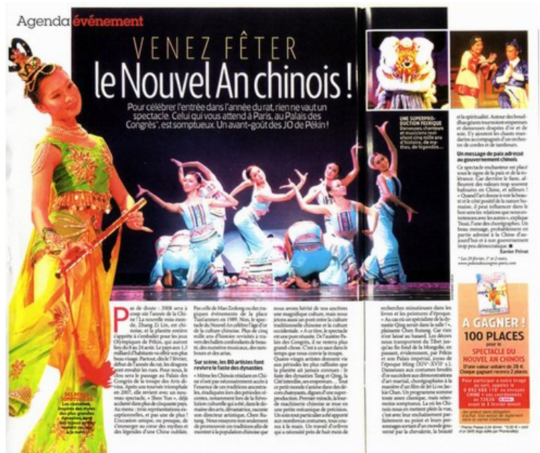
法国最大杂志《Femme Actuelle》介绍神韵晚会