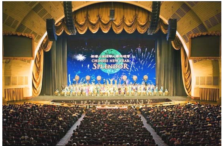
世界最大室内剧场纽约著名“无线电城音乐厅”神韵演出盛况

文章说，非常有趣的是，中共政权企图干预神韵在许多城市的演出。为什么呢？毕竟这个集众多顶级中国舞蹈家和音乐家的晚会是向西方人展示传统中国文化的顶级演出之一。但是从中共的角度来看，这场演出是颠覆性的。不仅这场演出不能在中国上演，如果回到中国，几乎肯定每个演员都会被逮捕并关押起来，甚至被酷刑折磨和杀害。非常不幸的是这毫不夸张，神韵的许多演员都是法轮功学员，而法轮功是一种基于“真善忍”的修炼却在中国受到残酷迫害。◇