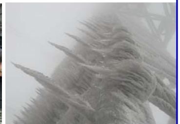
恐怖的电力铁塔厚冰