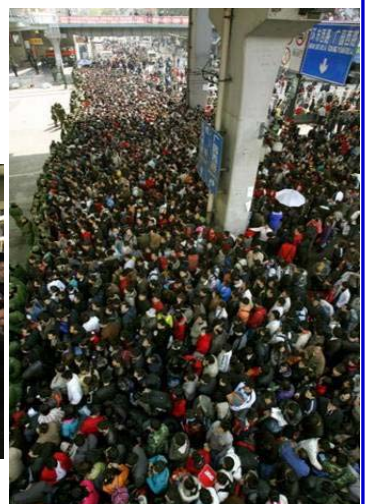
每天都有近 50 万人滞留的广州火车站