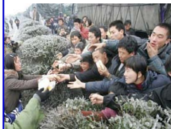
2.7 万辆车、8 万多名乘客和司机滞留在京珠高速公路湖南境内，有些乘客被困几天没吃东西。图为被困人群抢食品