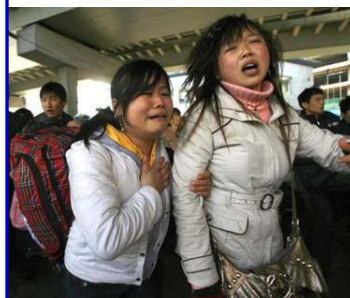
广州火车站，两年轻女性面对混乱的场面无助的哭泣。