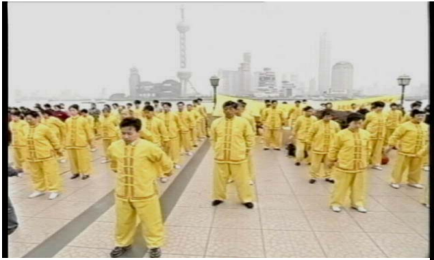
▲ 历史图片：1999 年 7 月法轮功遭受迫害之前，上海市法轮功学员集体炼功场景

依据法律，严肃地说，直到今天，炼法轮功在中国也完全是合法的。而对法轮功的镇压才是中共集团凌驾于法律之上的犯罪行为。