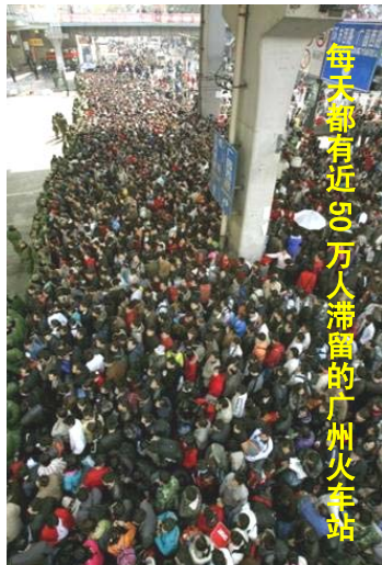
每天都有近 20 万人滞留的广州火车站

大小媒体的报道讲的都是干部领导如何奔赴救灾第一线，而对于真实的灾情则避而不谈。民众要想了解情况，只能突破中共的网络封锁，通过海外不受中共管制的媒体了解。一个远在他乡、急于了解家乡情况的贵州游子对于中共媒体的做秀