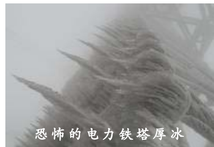
恐怖的电力铁塔厚冰

郴州市以及下属各县就是典型例子，是这次雪灾的重灾区之一。郴州市十多天断水断电，各行各业处于瘫痪状态，人们都说象一座死城。很多人因为银行关门而取不到买年货的钱；很多人每日以快