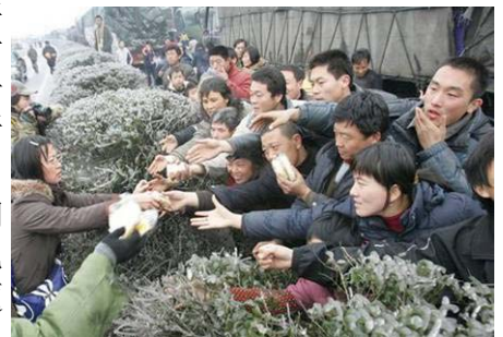
2.7 万辆车、8 万多名乘客和司机滞留在京珠高速公路湖南境内，有些乘客被困几天没吃东西。图为被困人群抢食品

其实，我们的中华老祖宗也是这样看问题的，“桑林祈雨”的故事就是一个例证。殷商史书上记载：成汤在位时久旱无