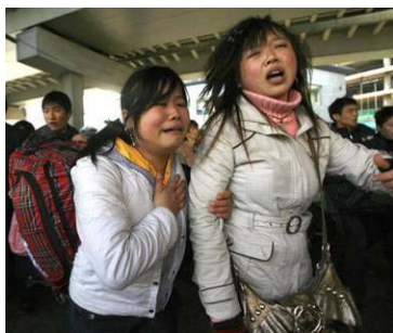
广州火车站，两年轻女性面对混乱的场面无助的哭泣。

今天的中国有多少罪恶正在发生？太多了！工人失业、农民失地，贪官横行，官商勾结，警匪一家，民不聊生，老百姓有怨无处诉，社会道德一日千里的下滑，中共已经祸国殃民到了如此地步，上天还能容它吗？中共篡政以来，害死了6~8千万的