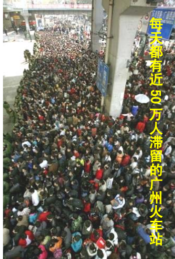
每天都有近 20 万人滞留的广州火车站

大小媒体的报道讲的都是干部领导如何奔赴救灾第一线，而对于真实的灾情则避而不谈。民众要想了解情况，只能突破中共的网络封锁，通过海外不受中共管制的媒体了解。一个远在他乡、急于了解家乡情况的贵州游子对于中共媒体的做秀