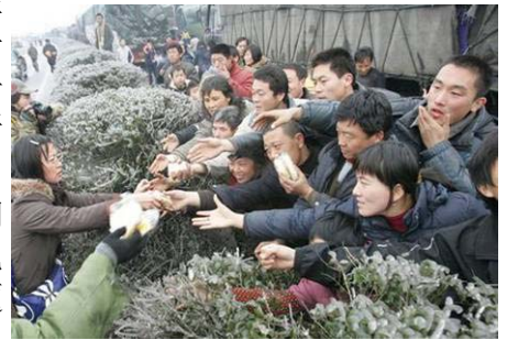
2.7 万辆车、8 万多名乘客和司机滞留在京珠高速公路湖南境内，有些乘客被困几天没吃东西。图为被困人群抢食品

其实，我们的中华老祖宗也是这样看问题的，“桑林祈雨”的故事就是一个例证。殷商史书上记载：成汤在位时久旱无