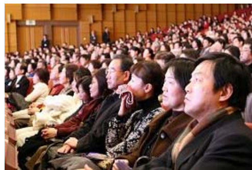
▲日本东京“文京市民会堂音乐大厅”，观众被神韵演出吸引。

东京都议会议员吉田康一郎表示，演出给他印象最深的是舞剧《觉醒》，“当人们看到善良的母女被迫害，