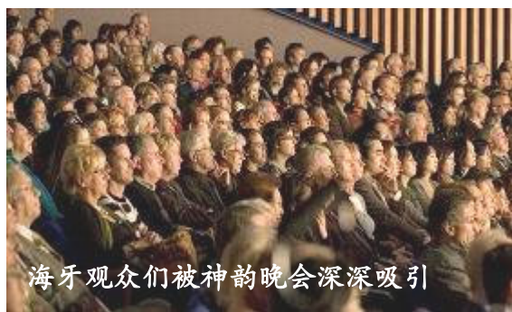
海牙观众们被神韵晚会深深吸引

当神韵晚会一开场“万王下世”大幕一拉开，就赢得全场观众的掌声，接下来的掌声响起在每一个表演节目的前后。