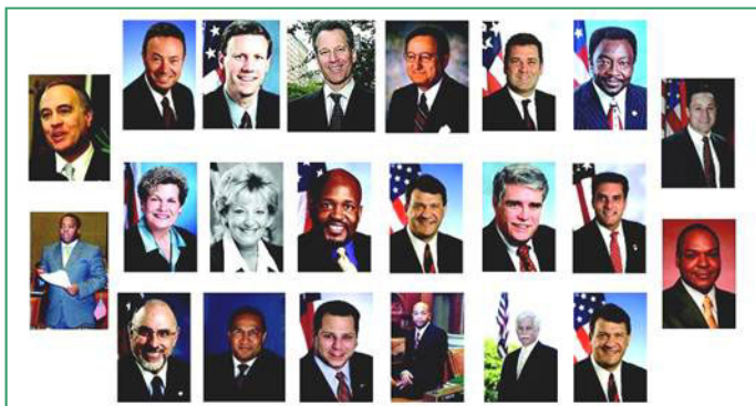
纽约七十多位政要（部份）预祝神韵演出圆满成功