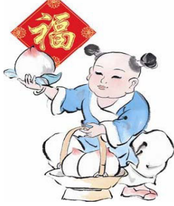
平山县全体法轮功学员 戊子年农历新年

心中牢记真善忍， 天赐洪福吉星照 诚念法轮大法好， 真诚善良有福报 中共灭亡是天意， 顺应天意灾祸消 多看资料明真相， 一年到头运气好