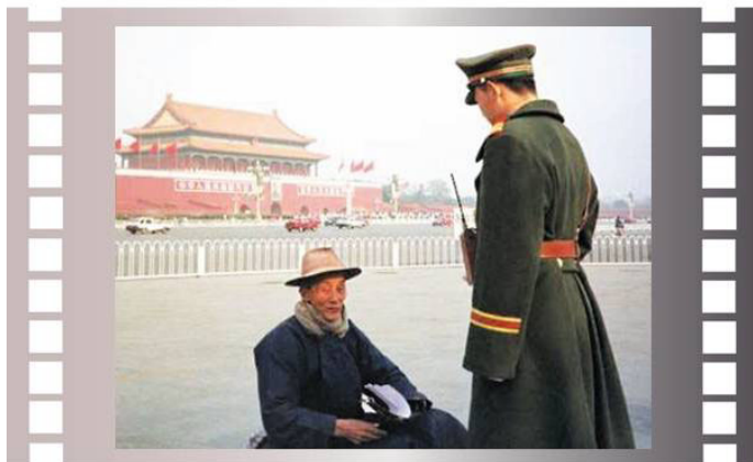
步行到天安门广场为法轮功和平请愿的老人

路上，我遇到了四位身穿淡蓝色的粗布衣裤、小腿打着腿带的人。每个人身上背着一个少数民族