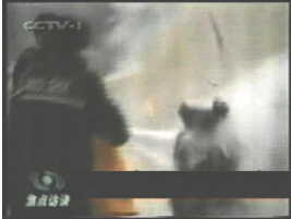
2、击打后飞出的重物