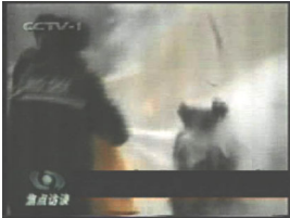
2、击打后飞出的重物