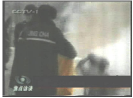
3、手摸被打后的头部