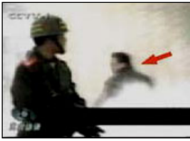
4、击打者仍保持用力姿势 23