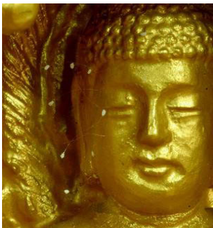
韩国须弥山禅院的佛像 脸上长出的优昙婆罗花。

1997年，韩国媒体首次报导了清溪寺出现优昙婆罗花，后来韩国媒体又相继报导了许多地方有奇花开放，引起佛教界的惊喜。接着在大陆各地陆续传出了优昙婆罗花开放的消息，并有很多见诸媒体报导。这种奇花也在台湾、香港、马来西亚、新加坡、澳大利亚、美国等世界各地处处绽放。这些事实明白的晓谕世人，佛经中传说的三千年才盛