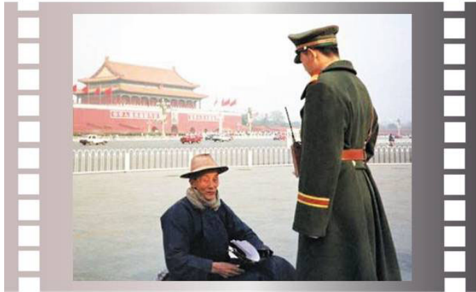
步行到天安门广场为法轮功和平请愿的老人

路上，我遇到了四位身穿淡蓝色的粗布衣裤、小腿打着腿带的人。每个人身上背着一个少数民族