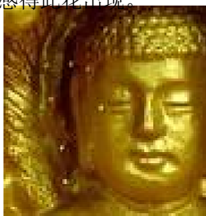
佛像上出现佛家传说中的 优昙婆罗花

优昙婆罗是梵文的音译，英文名为 Udumbara，意为灵瑞花、空起花、起空花。优昙婆罗花是传说中的仙界极品之花，此花花茎细如发丝，有韧性，花形如钟，白如雪，因其花“青白无俗艳”被尊为佛家花。