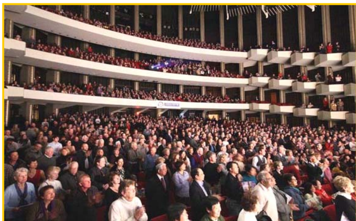
▲一月十四日加拿大渥太华第二场演出结束,全体观众起立,向神韵艺术团的法轮功学员们鼓掌致意。