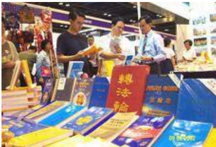
新加坡世界书展中的各语种法轮功书籍。(2002年6月)

◎ 目前世界八十多个国家和地区有法轮功修炼者；法轮大法使各国人民对中国的悠久灿烂文化更加向往，给中国赢得巨大的国际声誉。