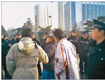
当局出动两万多名警察，围堵驱赶上访的蚂蚁养殖户。

“蚁力神”事件爆发至今，中共的所有官方媒体严密封锁信息。这和“蚁力神”骗局破产前，中央电视台、辽宁省卫视等各大媒体的吹捧、造势形成了鲜明对比。事发后，中共不保护百姓利益，而保护行骗者；政府不去关心百万养殖户，而是把他们当成“危险分子”去监