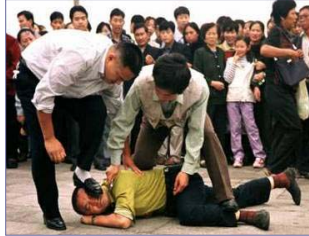
天安门便衣警察毒打上访、说明真相的法轮功学员

惩非法集资的“蚁力神”集团。据有关部门初步统计，“蚁力神”集团至少骗取了一百二十多万蚂蚁委托养殖户的二百多亿资金，范围以辽宁为中心，辐射吉林、黑龙江、内蒙等地。