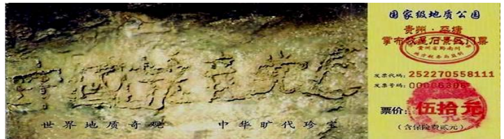
贵州省平塘县掌布乡风景区门票

——“藏字石”。经专家鉴定，此百吨巨石有两亿七千万年的绵长历史，五百年前从山崖坠落，座地一分为二，巨石断面上没有任何人工雕琢及人为加工的痕迹，“中国共产党亡”六个大字纯属“天成”。此自然奇观震惊了海内外，中共媒体也报导了此新闻，但隐去了‘亡’字，光提“中国共产党”。反而称其为“救星石”，许多人闻讯前去观看。平塘地方政府为此建起了红色旅游区，鼎力宣传，大搞旅游致富。