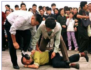
天安门便衣警察毒打上访、说明真相的法轮功学员