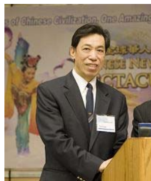
神韵艺术团团长著名男高音歌唱家关贵敏先生在嘉宾招待会上介绍晚会

【明慧网】由新唐人电视台举办、神韵艺术团担纲，历时 5 个月的“全球华人新年晚会”2008 年世界巡演将达 200 多场，席卷全球 70 多个城市，现场观众预计 65 万，规模空前。晚会每到一地都收得当地政府和政要颁发的褒奖状和贺信，媒体竞相报道演出盛况。无论中西观众，无论各个族裔，在一场以高超的中国舞为表现、中西乐器现场呈现的天籁之音、高科技动感天幕、惊叹的色彩和精美的华服，带领观众跨越五千年历史长河，领略恢弘博大的中华正统神传文化。晚会也带给海外华人久违了的新年回家的感觉，他们均为中国人能有这样杰出的演出而自豪。在旧金山首场演出后，有大陆同胞含泪致谢：承传中华香火。更有观众预定了 09 年的神韵晚会票。最为奇特的一幕是，有盲人“观众”慕名而来走进剧场感受“神韵”。