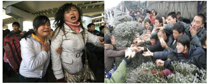
▲广州火车站，两年轻女性面对混乱的场面无助的哭泣。 ▲有些乘客被困几天没吃东西。图为被困人群抢食品

有的地方断水断电半个月。受灾人口超过 1 亿人，直接经济损失达到 537.9 亿人民币。饿死、冻死、挤死的人数目前无法计算，据一线报道，一条公路上就死亡 200 多人。