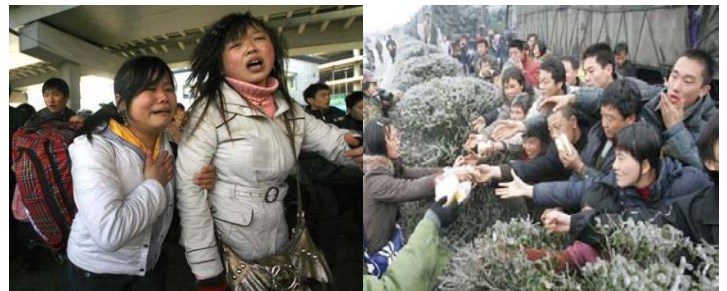
▲广州火车站，两年轻女性面对混乱的场面无助的哭泣。 ▲有些乘客被困几天没吃东西。图为被困人群抢食品

有的地方断水断电半个月。受灾人口超过 1 亿人，直接经济损失达到 537.9 亿人民币。饿死、冻死、挤死的人数目前无法计算，据一线报道，一条公路上就死亡 200 多人。