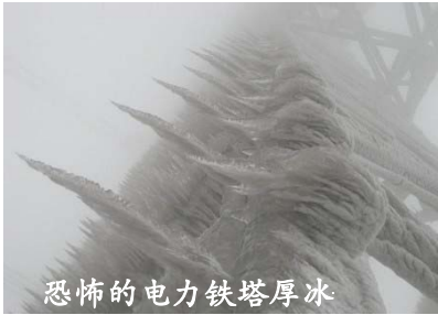
恐怖的电力铁塔厚冰

这种思想其实也是中华传统文化中所固有的思想，“桑林祈雨”的故事就是一个例证。殷商史书上记载：成汤在位时，久旱无雨。成汤沐浴斋戒，在桑林旷野中向神祷告，并在六件事上进行自我反省：“是因为我的政令有所不当还是由于我的管理不善，使得人臣失职，百姓失所；或是我的宫室修得太高，过于豪华，或是因为我听信嫔妃弄权乱政；或者是我法令不严，致使贪污受贿公行；或是由于我用人不当，使得谄媚小人得势！”成汤的话还没