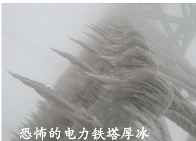
恐怖的电力铁塔厚冰

这种思想其实也是中华传统文化中所固有的思想，“桑林祈雨”的故事就是一个例证。殷商史书上记载：成汤在位时，久旱无雨。成汤沐浴斋戒，在桑林旷野中向神祷告，并在六件事上进行自我反省：“是因为我的政令有所不当还是由于我的管理不善，使得人臣失职，百姓失所；或是我的宫室修得太高，过于豪华，或是因为我听信嫔妃弄权乱政；或者是我法令不严，致使贪污受贿公行；或是由于我用人不当，使得谄媚小人得势！”成汤的话还没