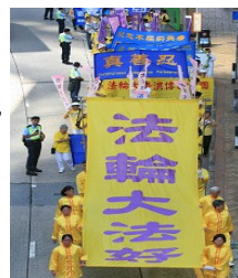
2007年7月14日香港法轮功学员举行盛大游行。

至2008年1月31日，全世界各国政府、组织机构、民间团体对法轮功及其创始人颁发的各项褒奖与支持议案达2899项，法轮功主要著作《转法轮》已被译成三十多种文字在全世界发行，法轮功所有书籍著作都可以在互联网免费下载。法轮功在全球范围的广泛传播，显示出“真善忍”超越民族、国界和时空的巨大威德和感召力。