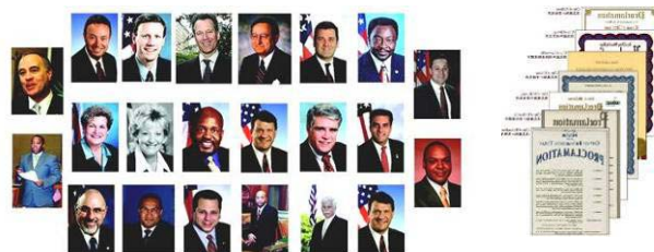
左：纽约七十多位政要为神韵发来贺信与褒奖。 右：美国德州十八位市长给神韵的嘉奖令。

西方人在观看后被中华神传文化博大精深的内涵所折服；海外华人看后更是激动不已，深感神韵复兴了中华文化，是所有华人的骄傲。