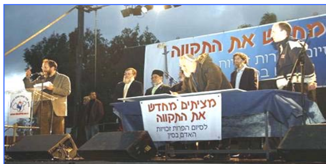
各宗教领袖吁中共停止反人类罪行

【明慧网】二月十八日，全球传递的人权圣火到达以色列，并在特拉维夫市中心举行了火炬接力仪式。活动在以色列引起巨大反响，全国性的新闻媒体对活动进行了密集报导，各大宗教及种族领袖签定共同契约，要求中共立即停止反人类罪行。